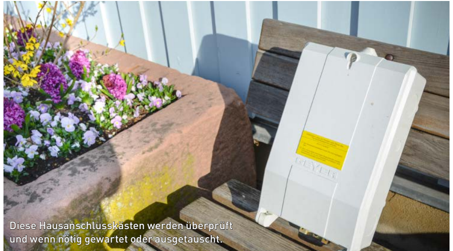
Diese Hausanschlusskästen werden überprüft und wenn nötig gewartet oder ausgetauscht.

Dort wo der Strom ins Haus gelangt, befindet sich der Netzanschluss. Die Stadtwerke schließen mit dem Endkunden einen Netzanschlussvertrag ab. Dieser informiert zum Beispiel über Kabelquerschnitt oder Größe der Hausanschluss Sicherungen. Überprüft werden die Hausanschlusskästen sowie die darin eingebauten sogenannten Panzersicherungen. Viele dieser Übergabestellen sind 60 bis 70 Jahre alt, da kann schon mal der Rost bei den elektrischen Kontakten ansetzen. Wenn ein Kasten defekt ist, wird dieser von den Stadtwerken ausgetauscht. „Die komplette Überprüfung sowie ein eventueller Tausch des Hausanschlusskastens ist für den Kunden kostenlos“, betont Gißler, Betriebsstellenleiter Technische Dienste Strom. Auch der Zählerschrank wird in diesem Zug überprüft. Die Stromexperten schauen, ob technisch alles einwandfrei ist und die Plomben ordnungsgemäß angebracht sind. Mancher der Kunden erhält