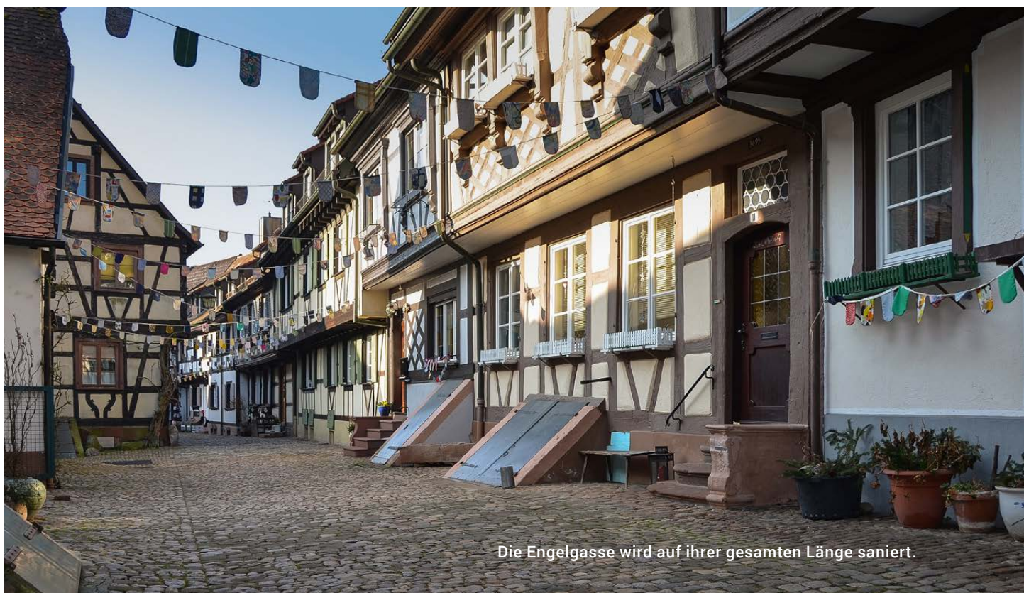
Die Engelgasse wird auf ihrer gesamten Länge saniert.

„Erhebliche Einschränkungen“ für die Anwohner wird es in jedem Fall geben. Aber die Stadtwerke sind bemüht, diese zu minimieren und zumindest für den Abend die Zugänge zu den Häusern entsprechend vorzubereiten, damit sie zu Fuß erreicht werden können. Auf den Zufahrten zur Engelgasse wird es ein Parkverbot geben, damit das Baumaterial ungehindert raus und rein gebracht werden kann. Mit den Bauarbeiten wird an zwei Stellen begonnen, bei der Bäckerei Kölmel sowie von der Reichstadt ausgehend. „Es ist eine Baustelle. Sie bringt Schmutz und nicht alles ist planbar“, betont Huber. „Aber wir sind alle Gengenbacher und reden miteinander. Wir finden immer eine Lösung.“