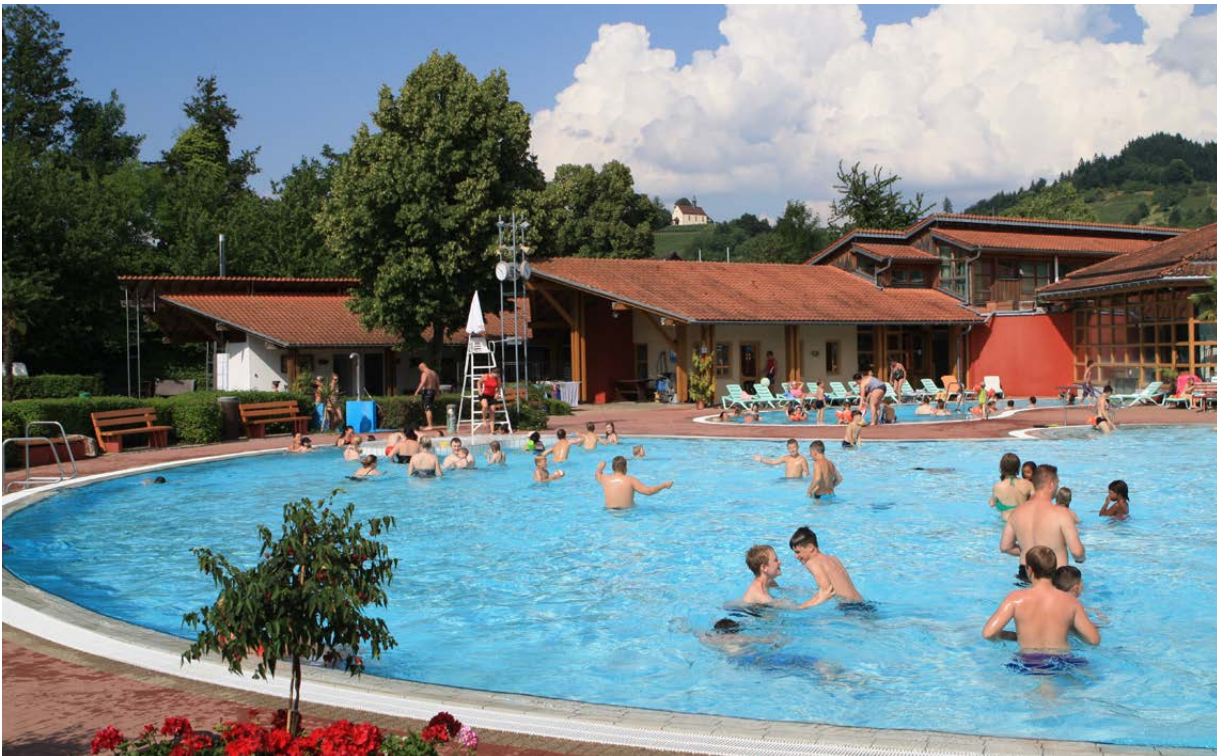
Teilnehmer können alle Leserinnen und Leser unseres Kundenmagazins „STADTWERKE AKTUELL“, ausgenommen Mitarbeiter der Stadt und ihrer Eigenbetriebe sowie deren Angehörige, die im gleichen Haushalt leben. Bei mehreren richtigen Antworten entscheidet das Los. Der Rechtsweg ist ausgeschlossen.